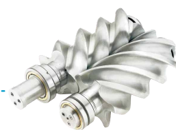
全新螺杆转子效率更高