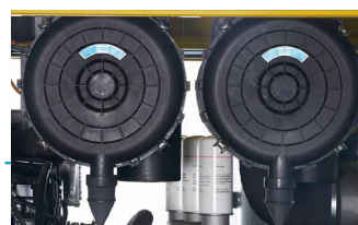
节油专家，省油降本