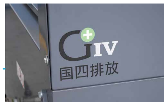
满足国四排放标准