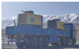
满足高海拔、低温、高寒工况