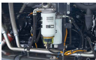
三重油滤，安全可靠